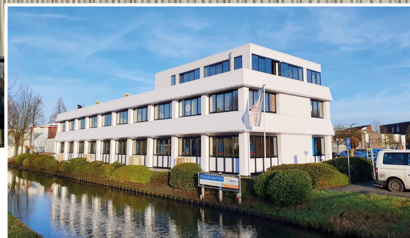
Kantoorpand in Papendrecht: van blauw naar mat wit

Een ander recent voorbeeld van een geslaagde visuele transformatie vinden we in Vianen, waar Holland Geveltechniek heeft meegewerkt om een onaanzienlijk pand nieuw leven in te blazen. De borstweringen kregen bronskleurige aluminium beplating met een levendig profiel en de kozijnen zijn gewrappt met folie in een antracietkleur.